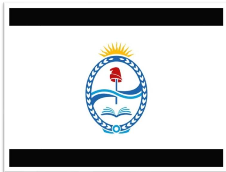
1: Video para registrarse como usuario del aplicativo

VER OTROS INSTRUCTIVOS Y VIDEOS DEL SISTEMA PJ-EXPRES (turnos) y como tramitar usuario y clave al sistema